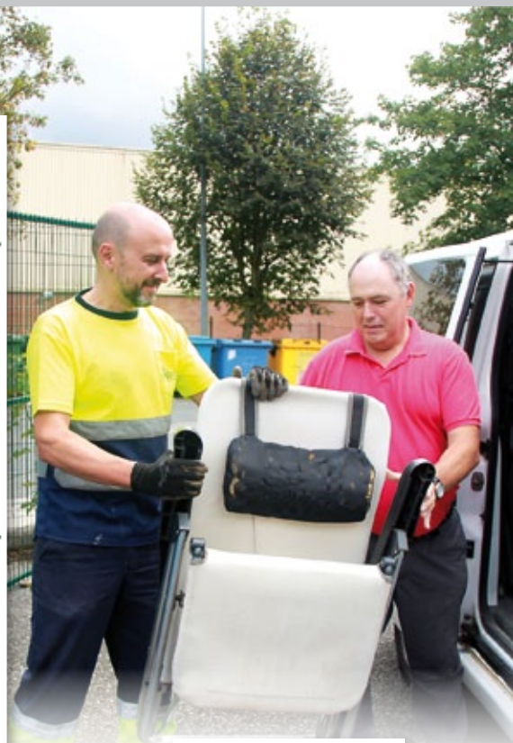
Herritarra trastea garbigunera ekartzen.

Bitartean, ordea, asko dugu egiteko, eta asko da sortzen duguna. Hori egoki bideratzeko elkarte eta enpresa batek laguntzen dute gure eskualdean. Bolumen handikoak eta etxetresna elektrikoak, esaterako, Traperos de Emausek