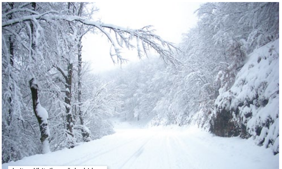
Leitza-Uhitziko gañeko bidea.