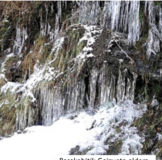
Basakabitik Goizueta aldera.