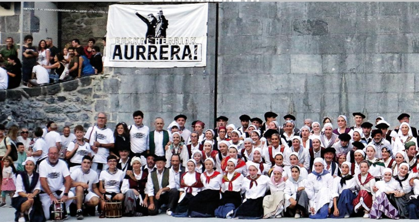
Belaunaldi ezberdinetako dantzariak aurtengo pestetan.

dugu noraino ailegatu gaitezkeen. Pre-sarik ez dugu; gogoia, ordea, bai.