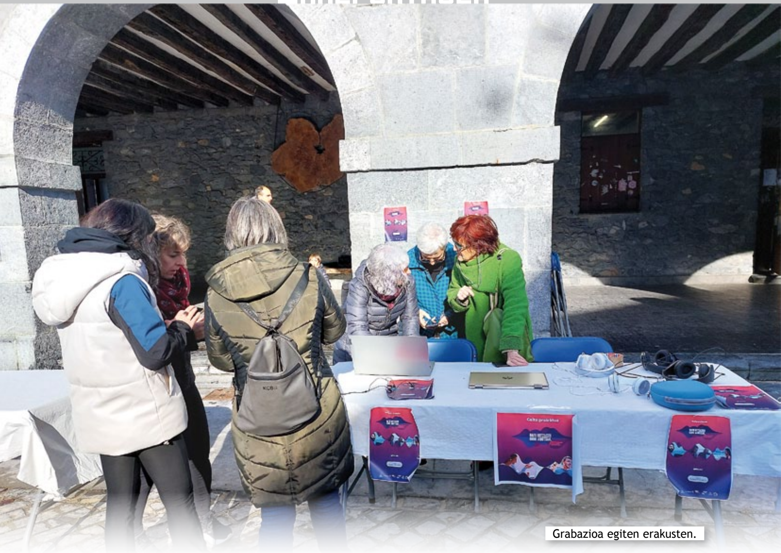
Grabazioa egiten erakusten.