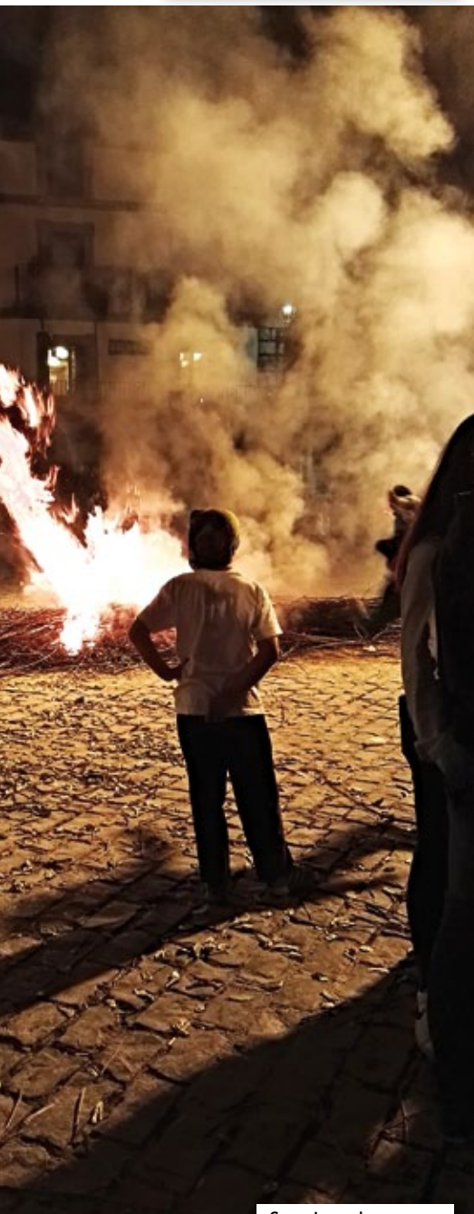
San Juan bezpera.