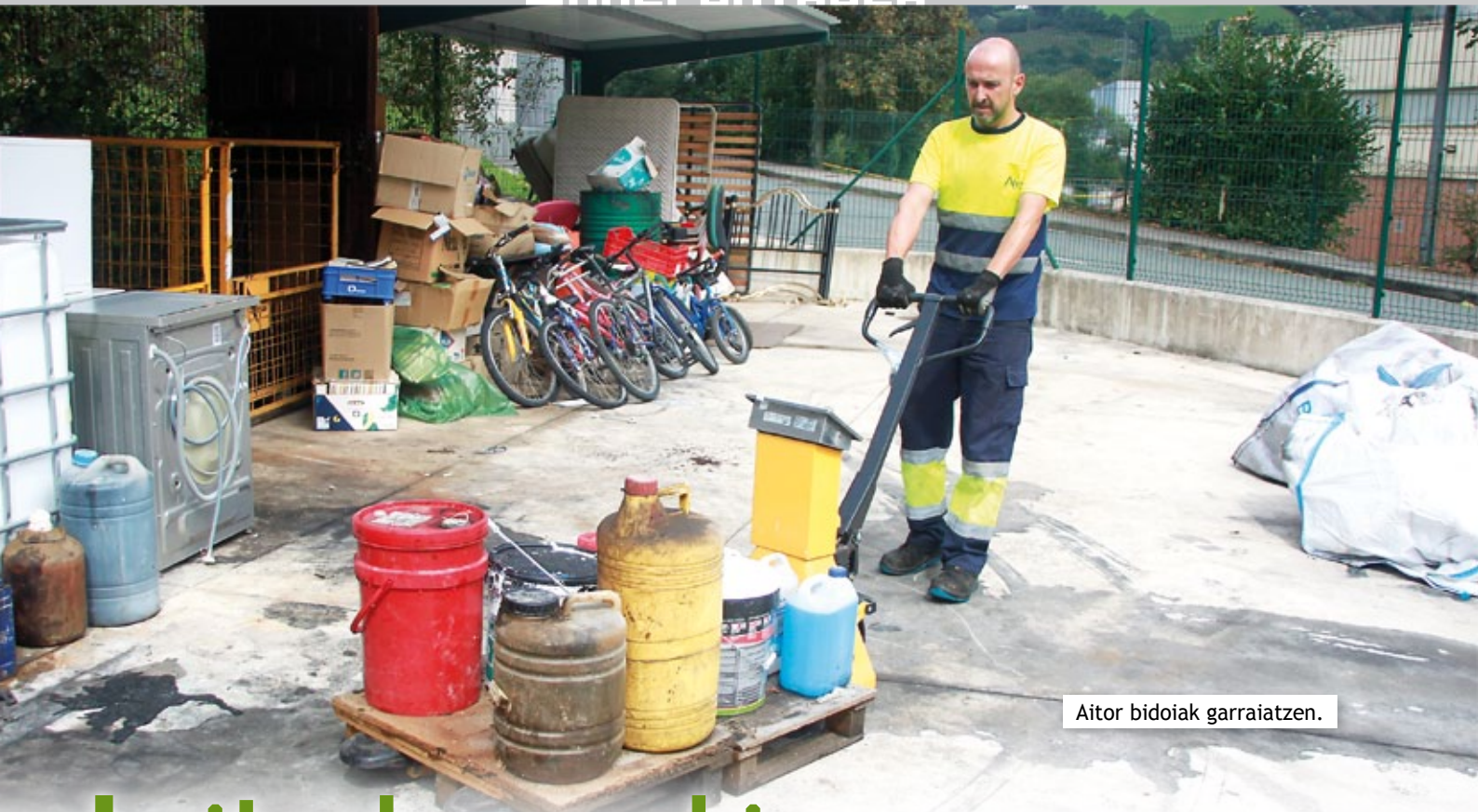
Aitor bidoiak garraiatzen.