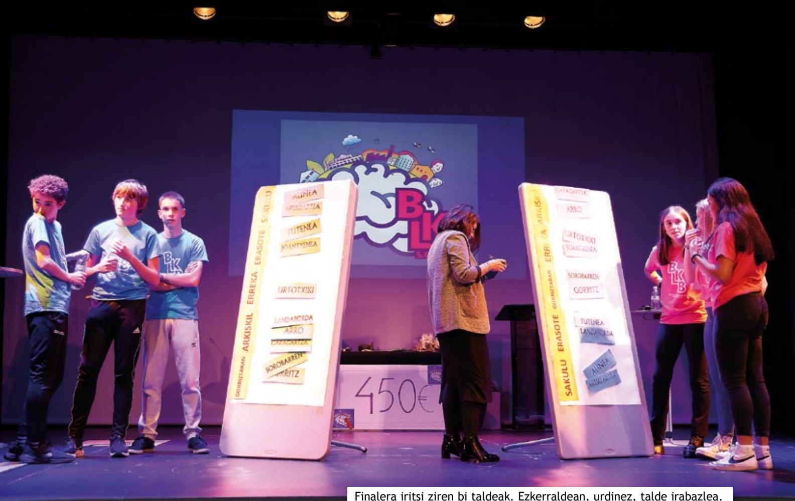
Finalera iritsi ziren bi taldeak. Ezkerraldean, urdinez, talde irabazlea.