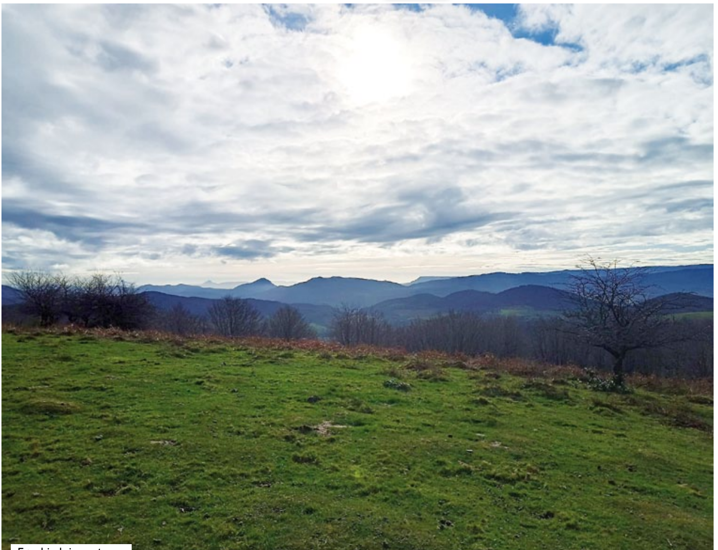
Eguzkia laino artean.