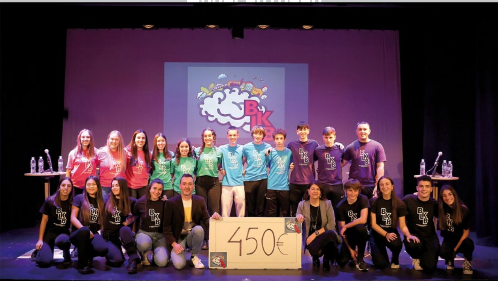
Balikebaleko lehiakideak eta laguntzaileak.

rako Herri Areto berria inauguratzeko zelako, baina martxoaren 15ean Covid-19aren pandemia iritsi zen, eta konfinamenduan sartu ginen. Ez zen Bali-kebalerik egin. Azkenean 2021eko abenduaren 17an eskaini zen emanaldia. Hura 4. edizioa izan zen.