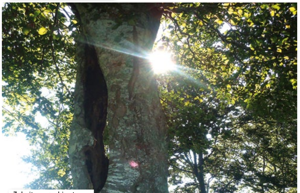
Zuhaitza eguzki artean.