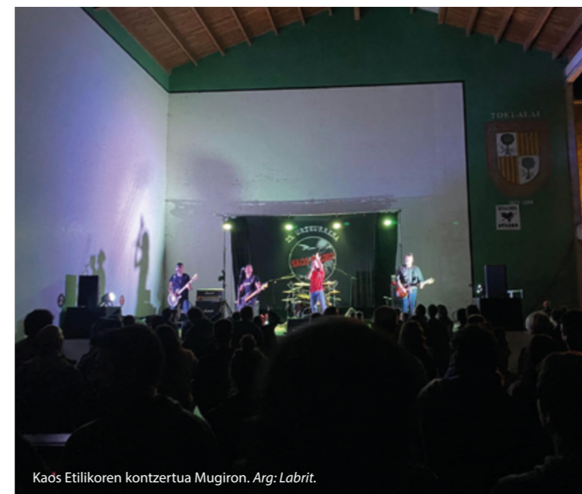
Kaos Etilikoren kontzertua Mugiron.