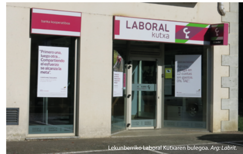
Lekunberriko Laboral Kutxaren bulegoa. Arg: Labrit.

Bernar: Harreman handia izan dugu beti jendearekin. Lehen, hemengoak ginen langile gehienak. Nahi zuten bertan bizi zirenak izatea langileak.