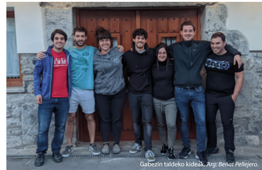
Gabezin taldeko kideak.

Iruñeko neska bat hasi da baxua jotzen, June. Zazpi gara taldean orain. Joseba eta biok gara hasiera-hasieratik gaudenak; Ainhoa urtebete geroago hasi zen. Bost