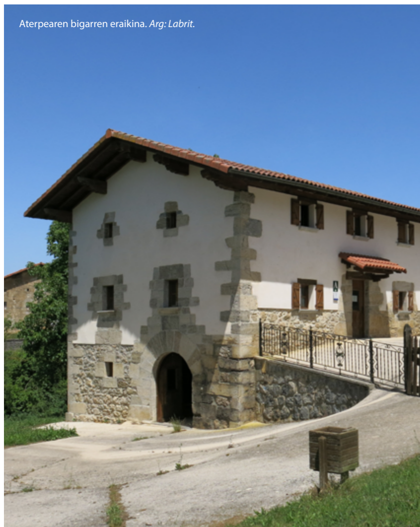
Aterpearen bigarren eraikina.

Ostatua nahiz aterpea kudeatu beharko dira, eta errenta 13.000 eurokoa izango da