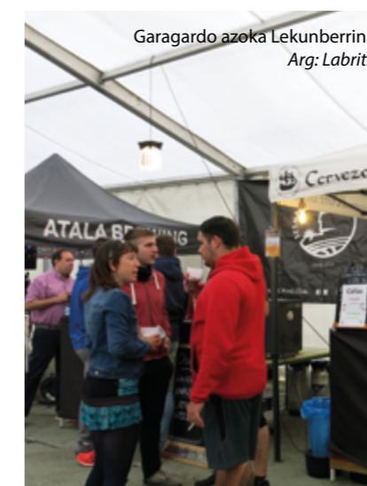
Garagardo azoka Lekunberrin.