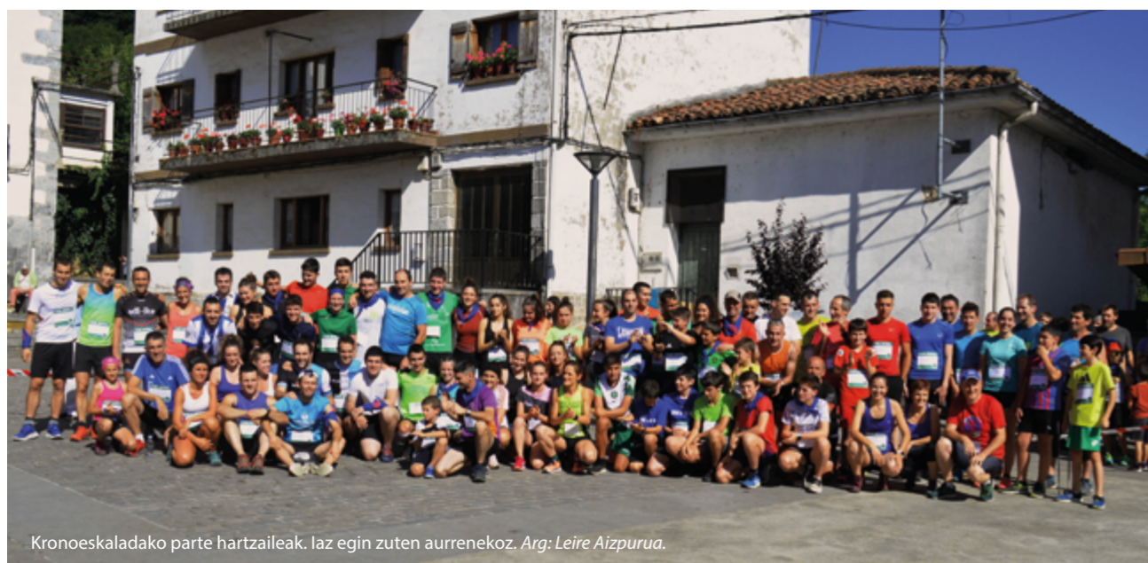
Kronoeskaladako parte hartzaileak. Iaz egin zuten aurrenekoz.