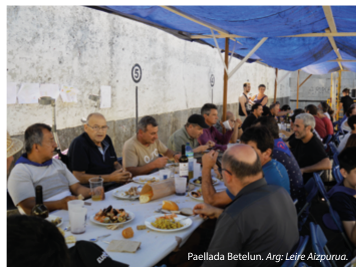
Paellada Betelun.