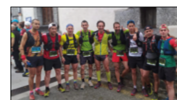
Euskal Herria Mendi Erronka lasterketa