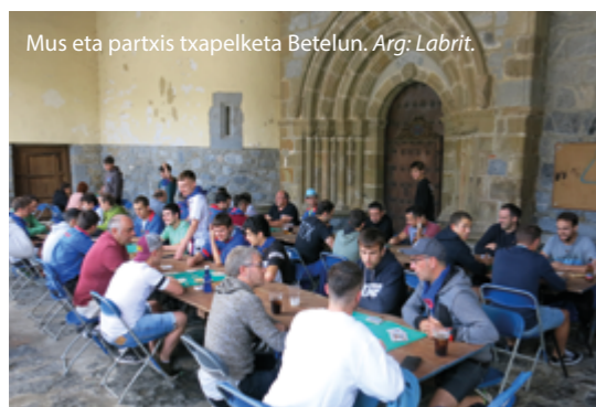
Mus eta partxis txapelketa Betelun.