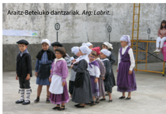
Araitz-Beteluko dantzariak.

Hasi dira udako herrietako festak, eta nabari da jendea gogotsu zegoela. Lekunberrin sanjoanak ospatu dituzte, eta Betelun eta Mugiron, berriz, San Pedro jaiak. Kontrazalean daude gainerako herrietako festetako egitarauak.