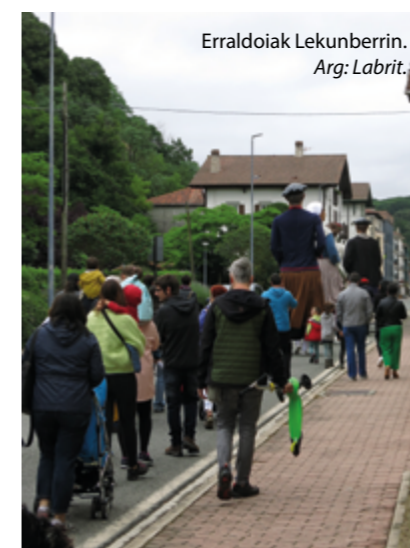
Erraldoiak Lekunberrin. Arg: Labrit.