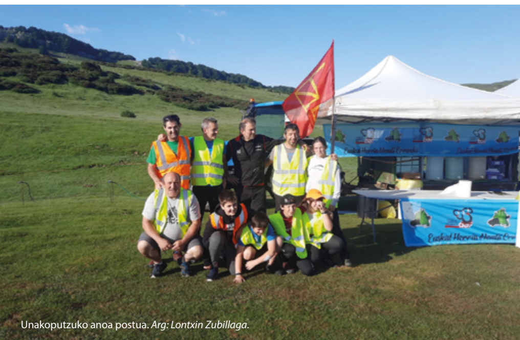
Unakoputzuko anoa postua.

Orejak. Gauzak hala, antolatzaileen artean ere tirabirak izan zituztela esan du, batzuk lasterketa antolatzaileen aldekoak zirelako eta beste batzuk ez, baina azkenean, inguruko udalek hauspotuta baita ere, ausartu egin ziren, lasterketa egitearen aldeko apustua egin zuten, baita ongi irten ere.