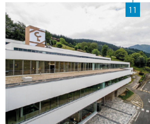
Arrasateko zentrala. Arg: Laboral Kutxa.

Bernar: Denetatik. Hemengo jendea normalean nahiko kontserbadorea da, eta ez genituen produktu oso bereziak saltzen. Gaur egungo langileei behartzen diete ahalik eta gehien saltzea. Guk ere aurreikuspen batzuk genituen, baina ez genuen halako agresibitate saltzeko orduan. Ospe handia genuen mailegu asko ematen genituelako, hori esaten zuten behintzat; hemen mailegu asko eman izan ditugun arren, berankortasuna ez zen beste mundukoa.