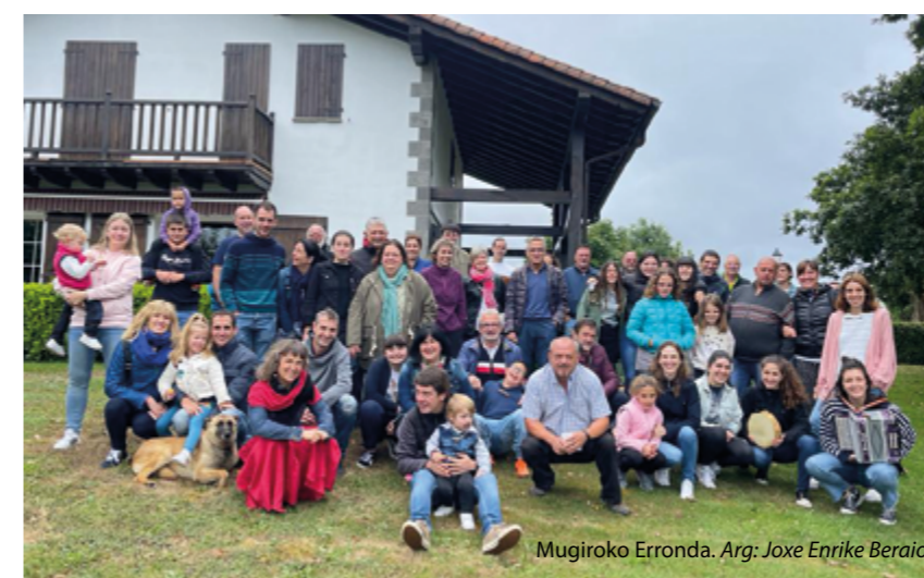
Mugiroko Erronda.