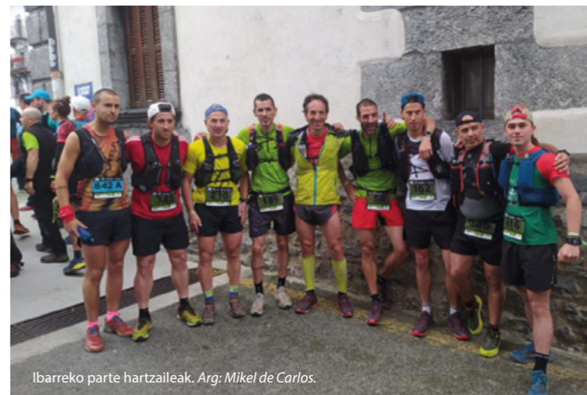
Ibarreko parte hartzaileak.