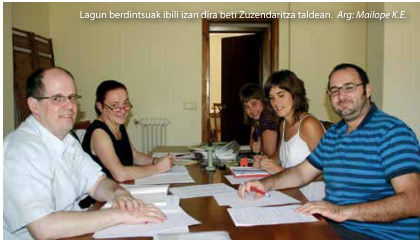
Lagun berdintsuak ibili izan dira beti Zuzendaritza taldean.