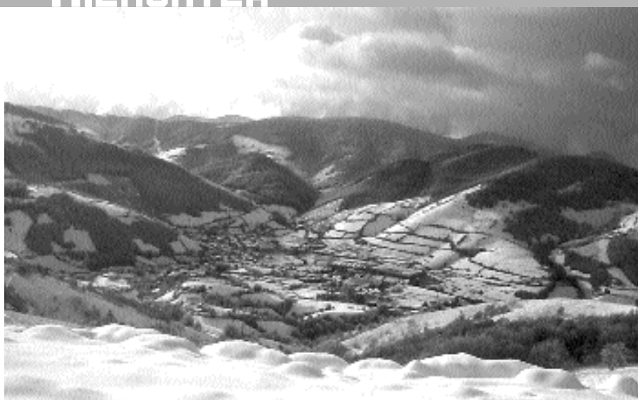
"Elurraren geruzak neguan herria estaltzen duen bezalaxe, euskararen geruzak urte osoan estal dezala"

Aipatu ditugu, bada, euskaldunen artean erdara zerga-