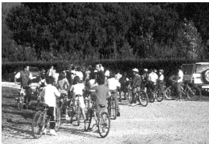
Haurrentzat antolatutako irteera bat, Plazaolako trenbidean. 2000ko iraila.