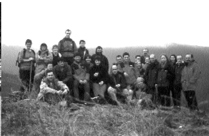
Mendibil taldearen irteera Leitzalarrean. 2000ko ilbeltza

koak irabazi zuen. Logotipoan Leitzako mapa ikus daiteke, tikuharri bat, armarriko otsoa eta, ohiko haritza egoten den tokian, piolet bat. Jakina da Mendibil Leitzako mendi baten izena dela, eta bertan trikuharri edo dolmen ezagun bat dagoela.