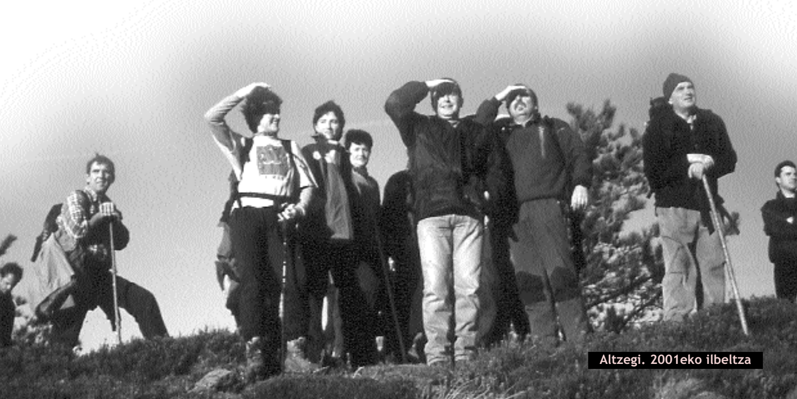
Altzegi. 2001eko ilbeltza

Hauxe duzue, beraz, MENDIBIL taldeaz esan litekeena, laburbilduta. Talde irekia da, edonor izan daiteke bazkide, eta edonork parte har dezake urtean zehar egiten diren irteeretan, jardueretan eta lanetan. Bertara hurbiltzen denak, mendiko proiektu eta jarduera ikaragarri eta goi-mailakorik ez du aurkituko, baina Euskal Herriko mendietan barna ibiltzeko aukera eta giro ona eta atsegina bai.