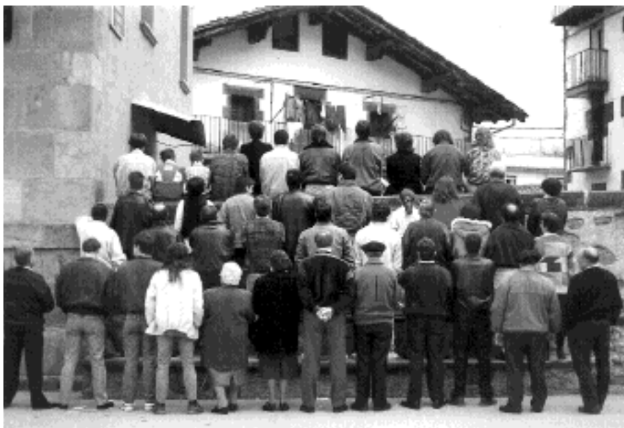
“Ez diezaiogun bizkarra eman euskarari”

Telebistan umorezko saioak ikustea besterik ez dago, hainbat euskaldunek hori oso barneratua dutela jakiteko. Kontakizunetan, sarritan, entzulearen algara eragin behar duena erdaraz esaten da. Zenbait gauza, antza denez, euskaraz esanda ez dira barre eragile. Hori, jakina, ez da horrela. Bestela pentsatu beharko genuke garai bateko euskaldunek, euskara besterik ez zekitenek, ez zutela umore-