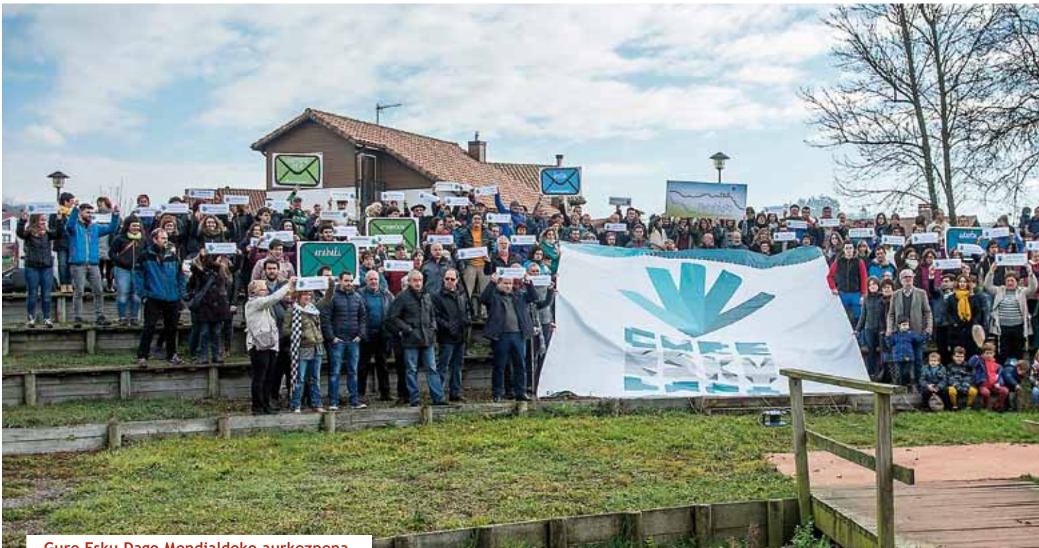
Gure Esku Dago Mendialdeko aurkezpena.