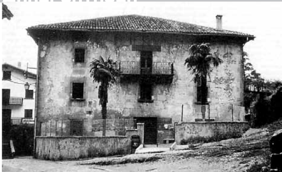
Etxe honetan garatu zen ikastolako egitasmoa hainbat urtetan.

Era berean, gizarte mailan mugimendu ezberdinek, politikoak batzuk, sozialak besteak eta egoeraren “inkonformismoaren” eredu bilakatu nahi zuten bestelako ildoak sortzen hasiak ziren Euskal Herriko eskoletan eskolak euskaldundu nahian. Eskola “nazionalak” izatetik, Euskal Herrian garatu behar ziren eskola mugimenduak sortzen hasiak ziren, Euskal Eskolaren hastapenak, alegia. Ereduen egituratzea nahitaezko pausoa bilakatu zen. Gaztelera hutsez izatetik, non euskaraz mintzatzeak debekua eta