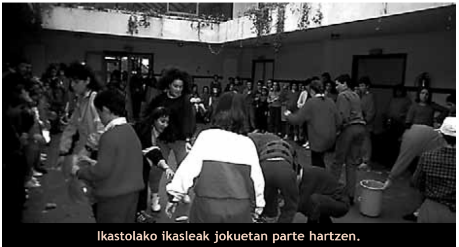
Ikastolako ikasleak jokuetan parte hartzen.