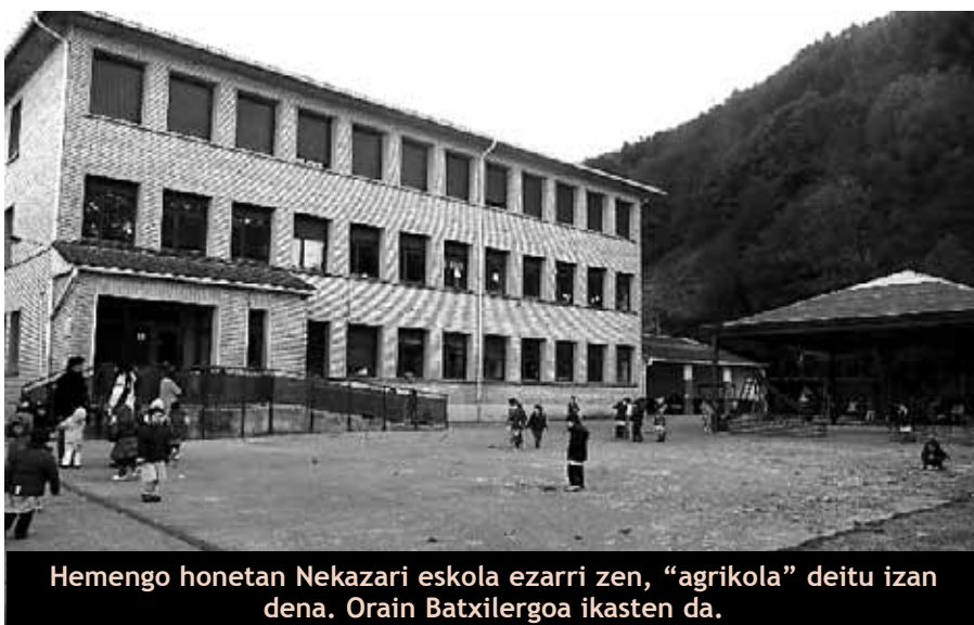
Hemengo honetan Nekazari eskola ezarri zen, “agrikola” deitu izan dena. Orain Batxilergoa ikasten da.