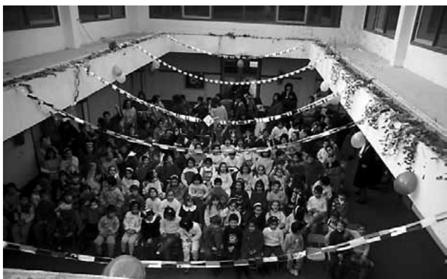
Behar ezberdinei erantzun nahian ikastetxea oraingo liburutegia eta Haur-eskola dagoen eraikinera eraman zen. Han amaitu zen ikastolaren ibilbidea.

zigorra zuen, euskararen presentzia gero eta nabarmenagoa izanen zuen bidea eraikitzen ari zen. Ereduak, bide horretan irtenbide modura planteatu ziren (A, B, D eta G Nafarroan), baina hauek euskarazko irakaskuntza jasotzeko esku-bidearekin egin zuten topo eta eredu eta zonifikatzea nahasi ziren, hau Nafarroan batez ere.