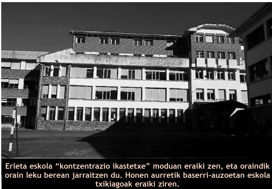
Erleta eskola “kontzentrazio ikastetxe” moduan eraiki zen, eta oraindik orain leku berean jarraitzen du. Honen aurretik baserri-auzoetan eskola txikiagoak eraiki ziren.