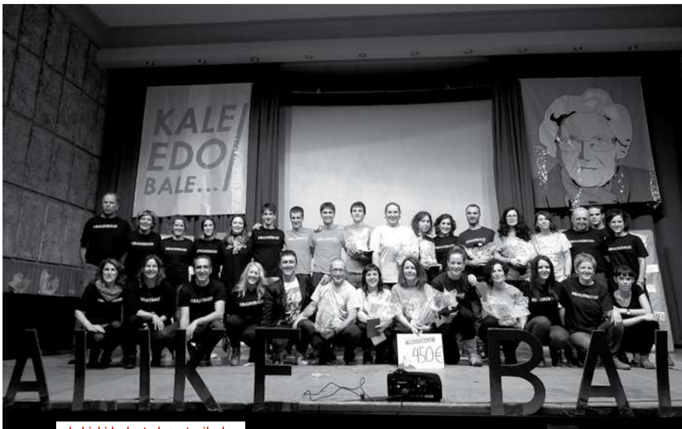
Lehiakideak eta laguntzaileak.