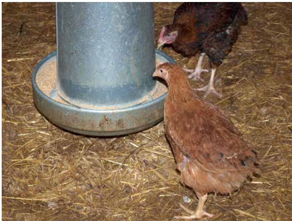
Ekologikoan, oilaskoak eta oiloak elikadura ekologikoarekin eta euren ziklo naturalak errespetatuz hazten dira.

O: Badittu bezeroak osasun arazoangatik produktu ekologikoak jateko gomen datu dioanak, edo besterik gabe kontzientziaturik dagoen jendea eta beste