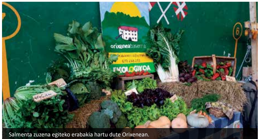
Salmenta zuzena egiteko erabakia hartu dute Orixenean.

I: Oso-oso ongi, iritsi giñenen ez giñun imajinatuko.