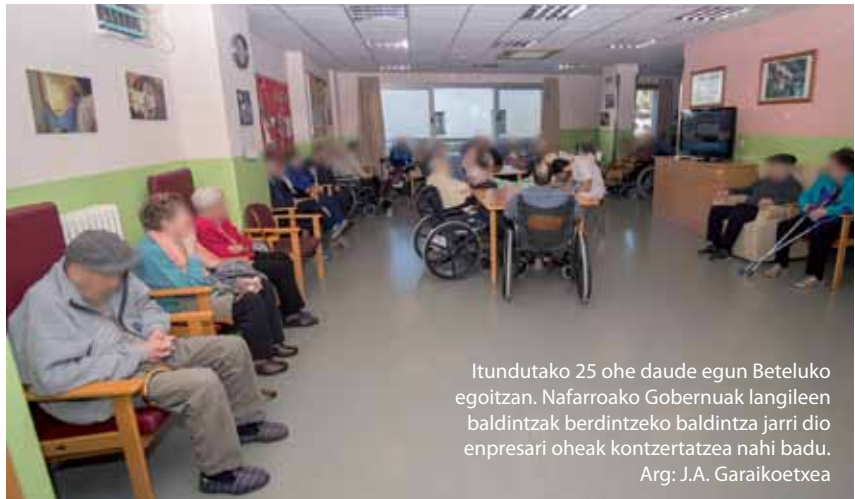
Itundutako 25 ohe daude egun Beteluko egoitzan. Nafarroako Gobernuak langileen baldintzak berdintzeko baldintza jarri dio enpresari oheak kontzertatzea nahi badu.

Bai. Enpresak momentua aprobeztatzeko egoitzako ohe guztiak itunduz gero, agian, gainerako egoitzetako langileen baldintza berdinetan lan egiteko aukera izango genukeela iradoki zuen. Horrek zenbait parlamentariaren haserrea piztu zuen. EH Bilduko Asun Fernandez de Garaialdek gobernuari xantaia egitea zela esan zion. Eta Geroa Baiko ordezkariak gurekin negoziatzera eseri ez izana aurpegiatu zion enpresari, euren hitzarmena ez onartzeagatik eta epaitegietara jo izanagatik zigortzen ariko bagintuzte bezala. Azkenean, Gobernuak gure baldintzak berdindu ezean ez duela plaza itundurik emango esan zigun. Eta