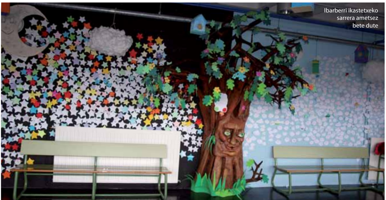
Ibarberri ikastetxeko sarrera amets ez bete dute