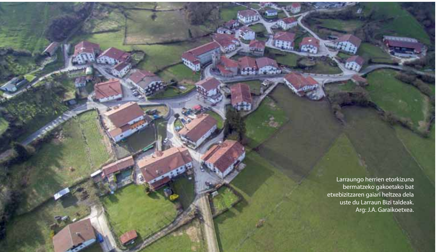
Larraungo herrien etorkizuna bermatzeko gakoetako bat etxebizitzaren gaiari heltzea dela uste du Larraun Bizi taldeak.

rriti, Uitz, Baraibar, Errazkin, Alli eta Arruitzek bat egin zuten etxebizitza sustatzeko hartutako erabakiarekin eta beste zenbait ere interesaturik agertu dira. Larraunen dauden etxe hutsen errola egitea adostu zuten besteak beste. Ibarren etxebizitzaren gaiari buruzko ikuspuntu orokor bat izateko eta jakiteko etxe horiek zein egoeratan dauden. "Gure asmoa emaitza horiek Larraungo Udalean aurkeztea da eta ondoren zehaztu egin beharko da zein eredu nahiz dugun eta konpromiso zehatzak hartu beharko dira, bai bertako institu-