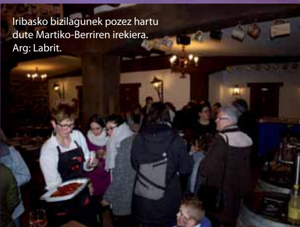
Iribasko bizilagunek pozez hartu dute Martiko-Berriren irekiera.

Araitz eta Beteluko Gure Esku Dago taldeak “Etorbizuna nafarron esku” ekitaldia antolatu du apirilaren 22rako. Eguraldi ona izanez gero, Arribeko plazan izanen da eta bestela Arribeko eta Atalluko frontoian egingen dute. Taldearen asmoa Gure Esku Dago ekimenak 2018. urte honetarako aurreikusitako ekintzen berri ematea da. “Goizez izanen da, eta ekintza sorpresaren bat ere izanen da jatekoaz eta musikaz gainera”. Izan ere, joan den hilean Nafarroako Gure Esku Dagok egindako aurkezpenean, bi egitasmo aurkeztu zituen. Maiatzaren 19an, Iruñeko Gazteluko plaza Mosaiko koloretsu bat osatuko dute eta ekainaren 10ean giza-katea egingen da.