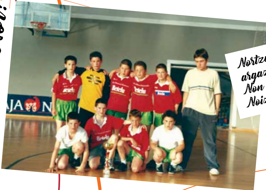
Nortzuk azaltzen dira argazkian? Non ateratakoa da? Noiz ateratako argazkia da?

Bidali iezazkiguzu zure argazkiak denon gozamenerako mailope@labrit.net helbidera edo 638 652 339ra deitu eta kudeatuko dugu.