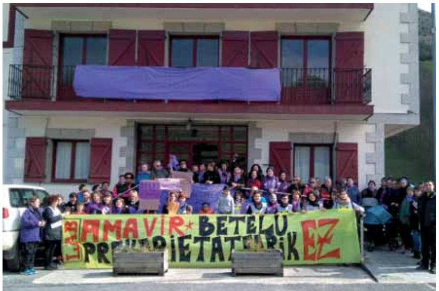
Langileek bat egin zuten martxoaren 8ko lanuztearekin eta herritarren babesa jaso zuten.

Bai, ibarreko herritarren erantzuna oso ona izan da. Gure borrokarekin bat egiten dutela esan digute, ez zaiela normala iruditzen enpresa berean, lan