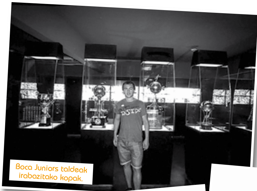
Boca Juniors taldeak irabazitako kopak.