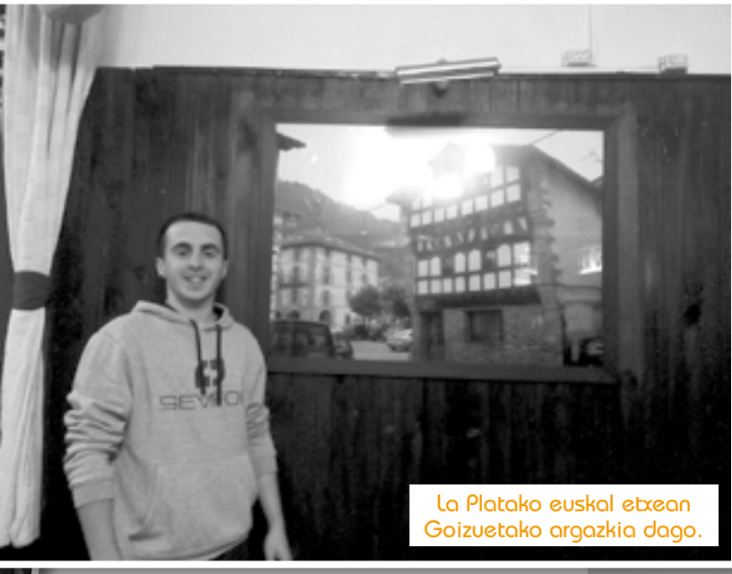
La Platako euskal etxean Goizuetako argazkia dago.