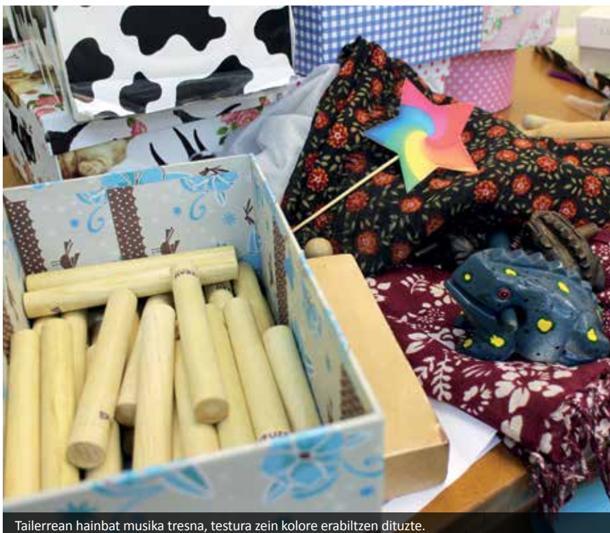
Tailerlean hainbat musika tresna, testura zein kolore erabiltzen dituzte.