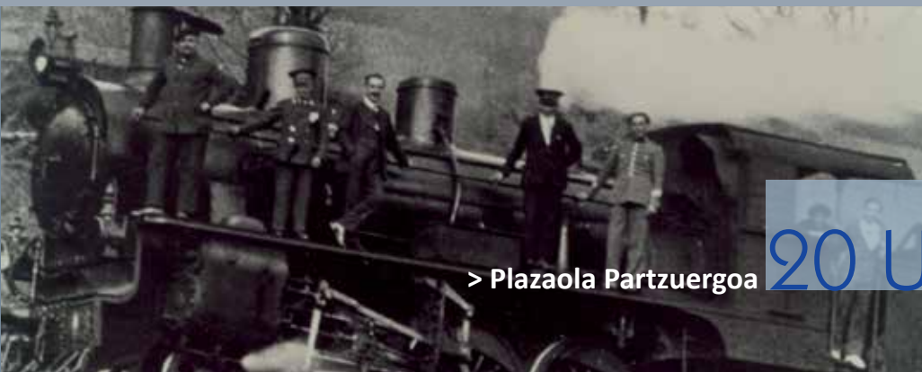
> Plazaola Partzuergoa