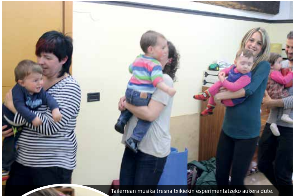
Tailerrean musika tresna txikiak esperimentatzeko aukera dute.

Argi izan behar da ez direla musika konbentzionala ikastera etortzen. Musika onuragarria da beste edozein hizkuntza bezala. Gainera musika ere beharrezkoa da garuna eraikitzeke eta autonomia horretan laguntzeko. Estrategia desberdinen arabera, alde batetik guraso eta haurren arteko harreman hori bideratzen da hainbat baliabideren bitartez, jolasen bitartez, ipuinen bitartez, erritmo jolasen bitartez... Helburuetako bat, beraz, entzumena