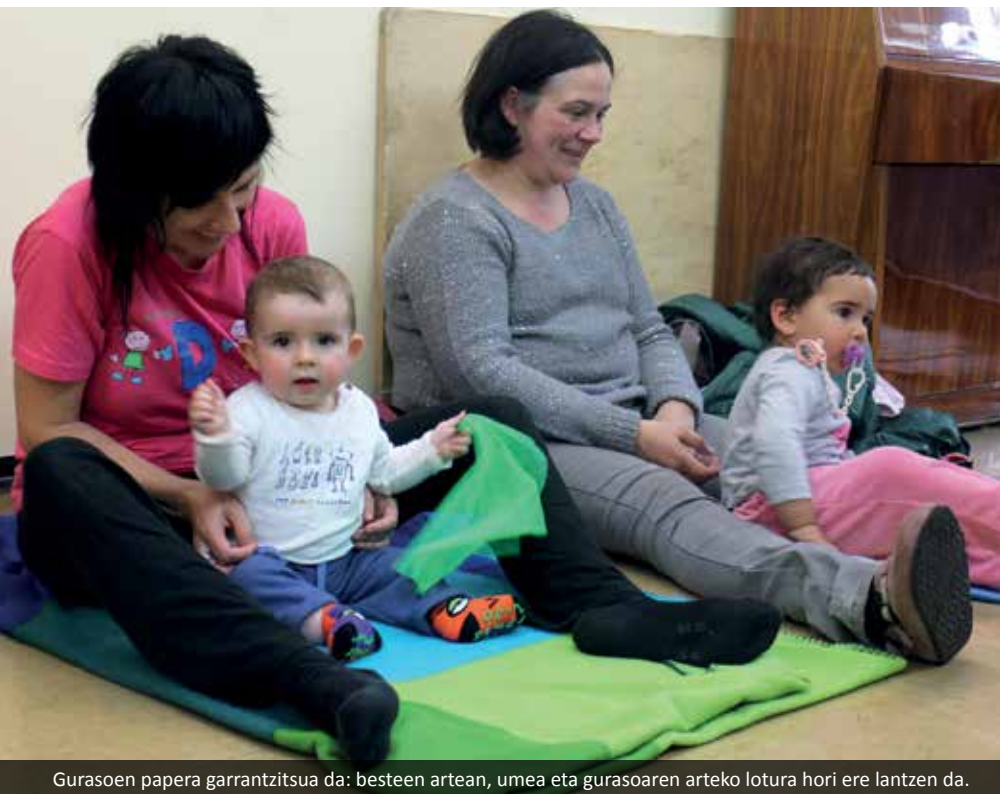
Gurasoen papera garrantzitsua da: besteen artean, umea eta gurasoaren arteko lotura hori ere lantzen da.

txoa sortzen da, ordubete horretan egotea. Baina esan bezala, gurasoak ez dira ezinbestekoak.