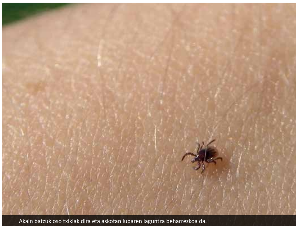
Akain batzuk oso txikiak dira eta askotan luparen laguntza beharrezkoa da.

Astebete edo hamar egun. Baina due-la lau hilabete egun batean porru eginda jeiki nintzen, inolako indarririk gabe, oinez ibiltzeko gai ere ez nintzela eta medikuarengana joan nintzen eta azaldu nion akainen hozkarekin erlazonatutako zerbait izan zitekeenaren susmoa nuela. Medikua analisi pila bat egin zizkidan beste aukera batzuk baztertzeko eta dena ondo zegoela. Baina orduan etorri zitzaidan burura 2015ean Gipuzkoako egunkari batean azalduetako erreportaje bat non