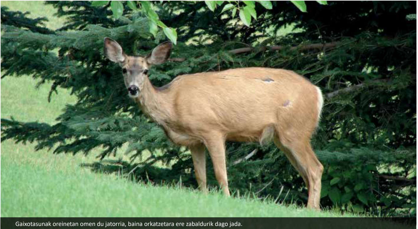
Gaixotasunak oreinetan omen du jatorria, baina orkatzetara ere zabaldurik dago jada.

Batzuk Belgikara joaten dira tratamendua egitera. Talde horretan badira ere gaixotasuna euren seme-alabek duten bi edo hiru emakume.