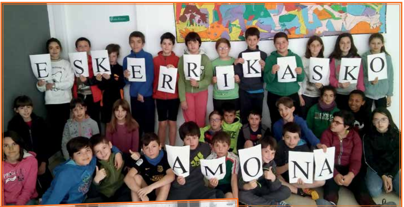
Ibarberriko 5. mailako ikasleak.