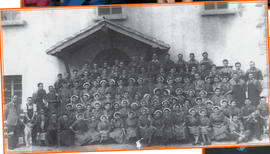
Mota honetako argazkiak ekarri dituzte ikasleak.