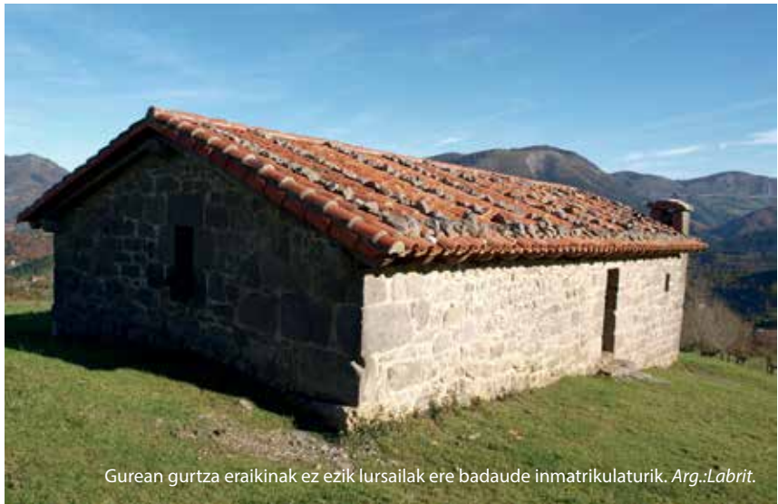
Gurean gurtza eraikinak ez ezik lursailak ere badaude inmatrikulaturik.