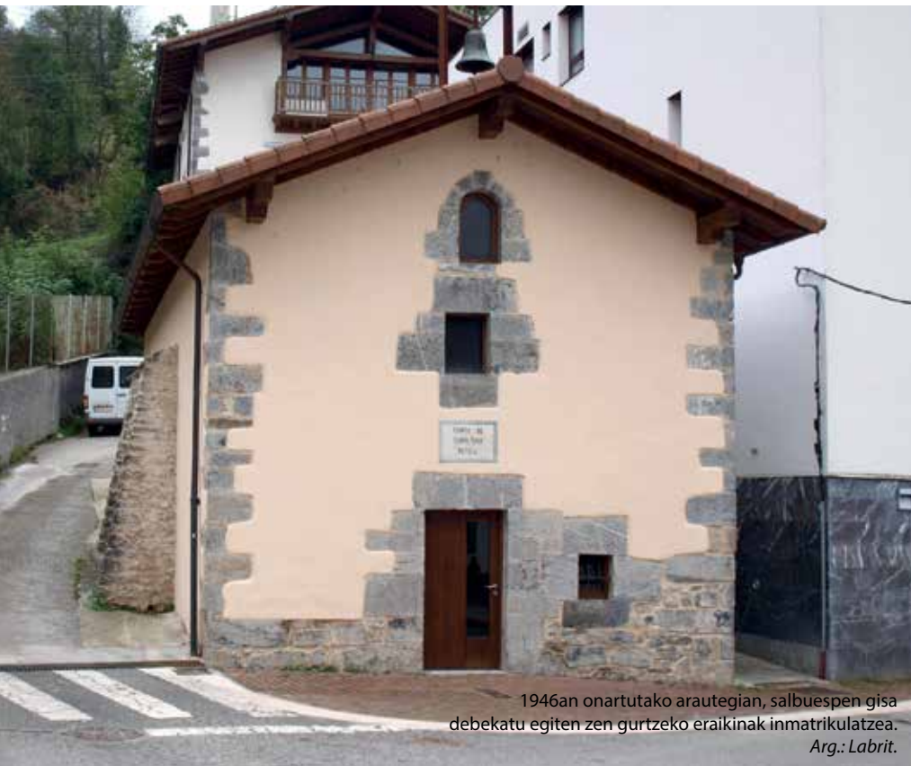
1946an onartutako arautegian, salbuespen gisa debekatu egiten zen gurtzeko eraikinak inmatrikulatzea.

1998. urtera arte bestelakoak inmatrikulatu ziren, apezetxeak, elizen aurrealdeko lorategiak, elizaren atzeko kaleak, hilerriak, elizaren kontra zeuden frontoiak, apezetxeko baratzak... Hala ere, tranparen bat edo beste ere aurkitu dugu, adibidez lursail baten titulartasuna aldatzea, lursail horretan eliza bat dagoela zehaztu gabe... Eta Zaragozan debekaturik egon arren, eliza bat inmatrikulatu zuten zuzenean. Horrek adierazten digu zer nolako konplizitatea zegoen Jabetza Erregistroko langileen eta Elizaren artean. Elizak egiten zituen arau-hauste horien jakitun, Jose Maria Aznarrek, 1998. urtean salbuespen hori bertan behera utzi zuen eta gurtzako eraikinak ere inmatrikulatzeko bidea ireki