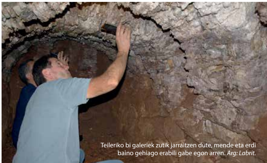
Teileriko bi galeriek zutik jarraitzen dute, mende eta erdi baino gehiago erabili gabe egon arren.

“Teilak, hondar-adokinak eta baldosak egiten ziren”