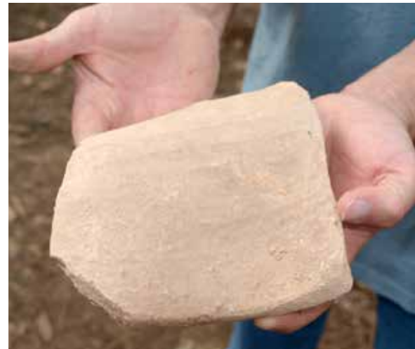
Goian, Iruña eta Donostia lotzen zituen errege-bidean dagoen Teileriko zubia. Behean, teileria eraikitzeko erabili zen hondar-harria.

J: Bai. Hemengo buztina nahiko gorria zen. Lurrak bere koloreak dauka eta kasu honetan, manganeso edo burdin oxido dezente dauka. Hemengo harri guztiak ostio-harriak dira,