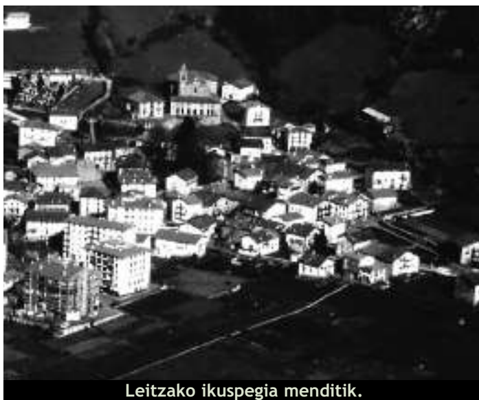
Leizako ikuspegia menditik.

www.empleatenavarra.net webguneak proiektu horretan egindako lana jasotzen du, zehatz-mehatz.