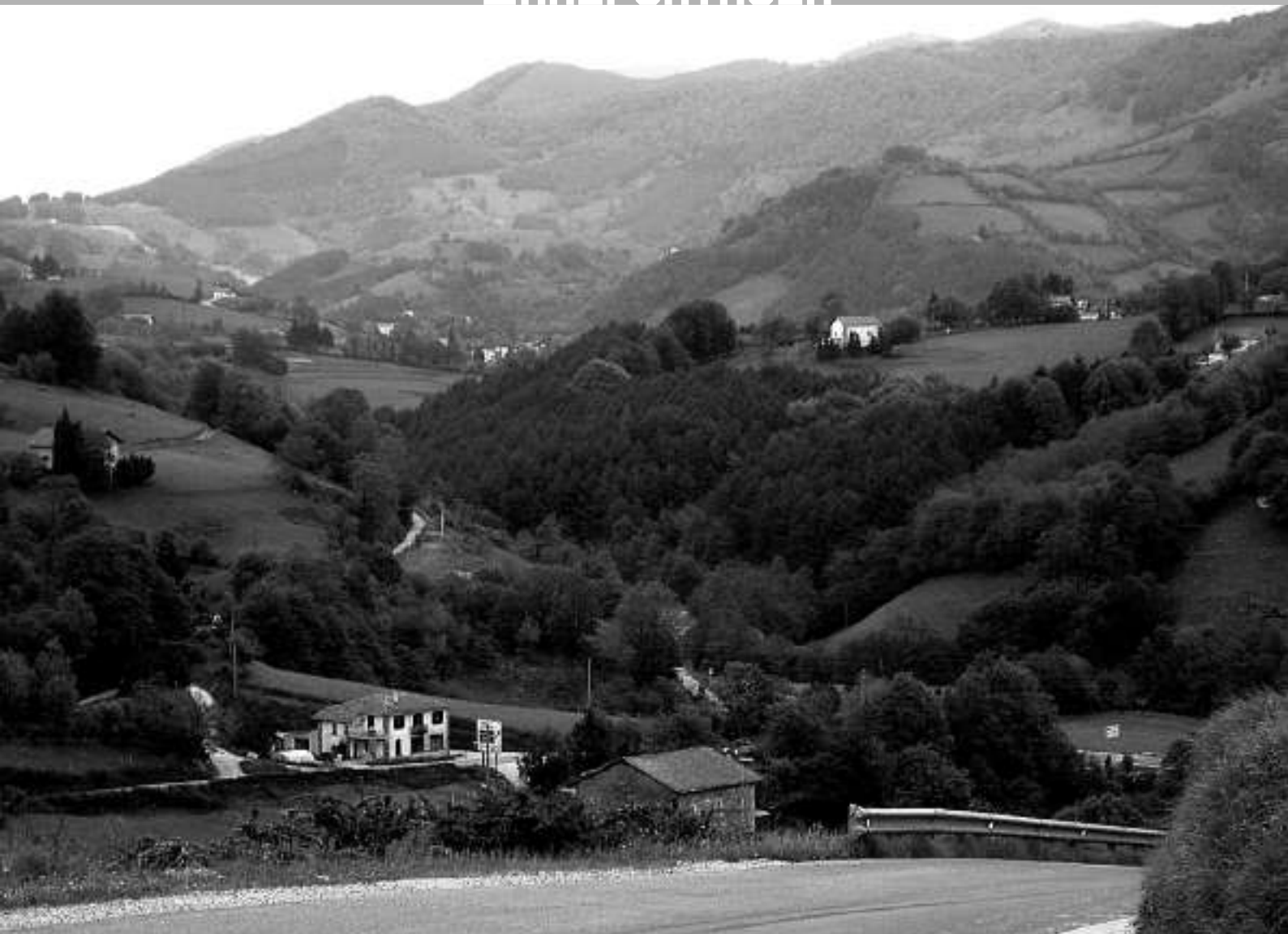
Areso industrialdearen sarrera.

zarte osoari egin diezaioketen ekarpen positiboa azpimarratuko da, eta aniztasunak dituen onurak bereziki nabarmenduko dira.