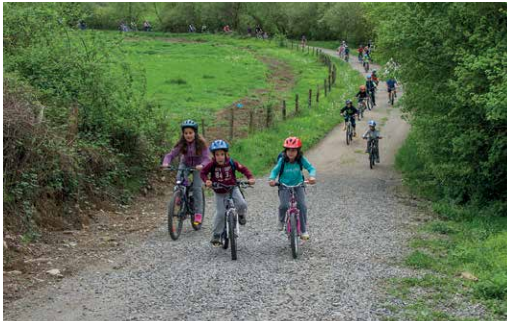
EuroVelo proiektuak Europatik datorren Europako bide berdeen sarera lotuko du Plazaola.