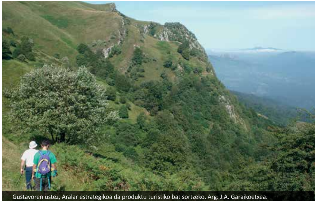
Gustavoren ustez, Aralar estrategikoa da produktu turistiko bat sortzeko.

Bai, nik ez dut ezagutu nola izan zen pro- zesua, baina dudarik gabe horrek ez du bat egiten bide berdearen filosofiarekin. Egina dago eta egia da aukera ematen diola ibiltariari Mugiro ezagutzeko eta jendea bertara hurbiltzeko eta hori ga- rrantzitsua da. Baina uste dut aurretik