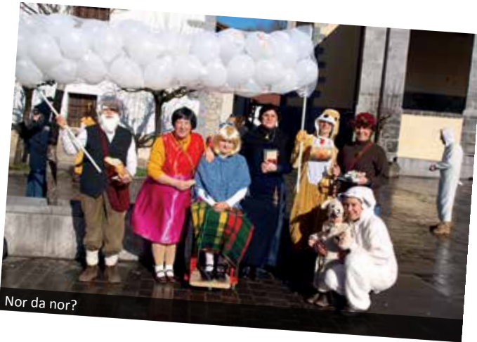
Nor da nor?