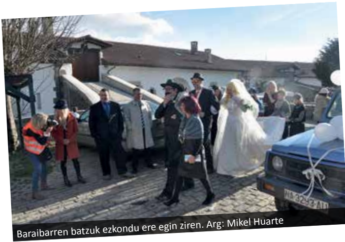
Baraibarren batzuk ezkondu ere egin ziren.