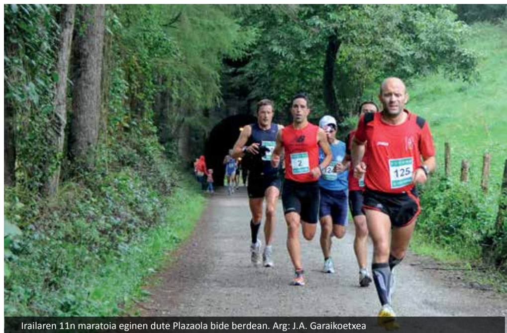
Irailaren 11n maratonia egingen dute Plazaola bide berdean.

Bai bai eta ilusio handiarekin nago. Askok eskertzen dut udal ordezkariak, bazkideak eta oro har jendeak izandako jarraera eta ea martxoan estrategia hori lantzen hasten garen. Ez da bide erraza izango baina gogotsu.