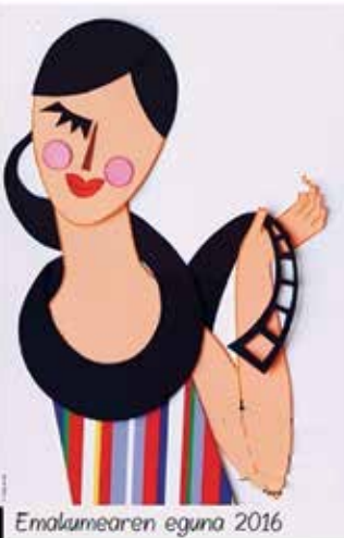
Emakumearen eguna 2016