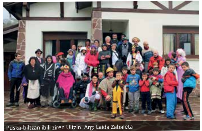
Puska-biltzan ibili ziren Uitzin.