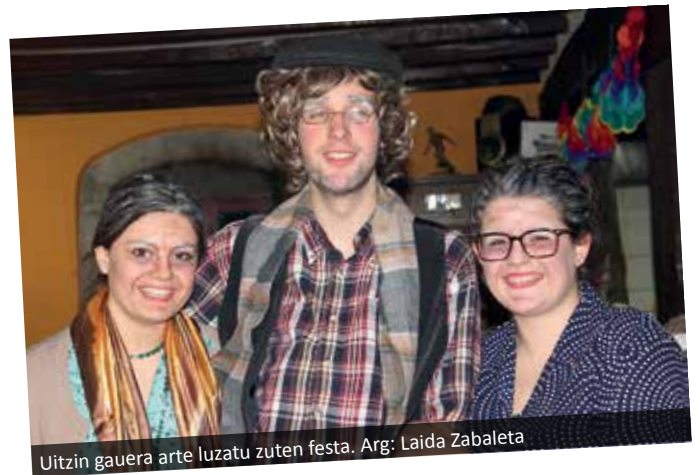
Uitzin gauera arte luzatu zuten festa.