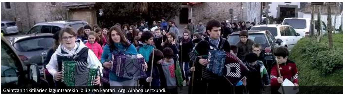
Gaintzan trikitilarien laguntzarekin ibili ziren kantari.