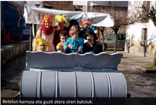
Betelun karroza eta guzti atera ziren batziuk.