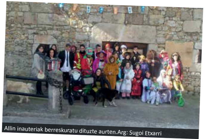
Allin inauteriak berreskuratu dituzte aurten.