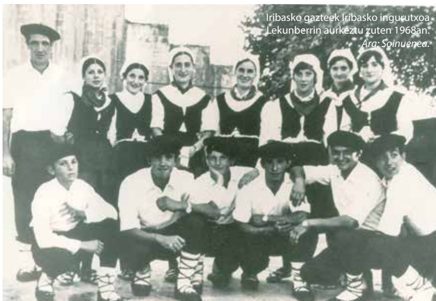
Iribasko gazteek Iribasko ingurutxoa Lekunberriin aurkeztu zuten 1968an.

Ingurutxoa herri gehienetan dantzatzen zen garai batean eta batetik bestera aldaera txikiak bazituen ere ia berdina zen haraneko herri guztietan. J.M.: “Iribasen ematen dugun ingurutxo hori Larraunen ezagutzen den Ingurutxoaren bertsio bat da. Ez zegoen ezberdintasun handirik, Ingurutxo guztiek hiru zati dauzkate, Inguru handi, Inguru txiki eta gero