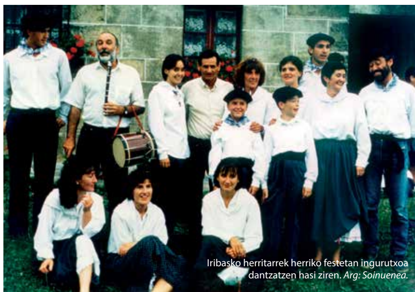
Iribasko herritarrek herriko festetan ingurutxoa dantzatzen hasi ziren.