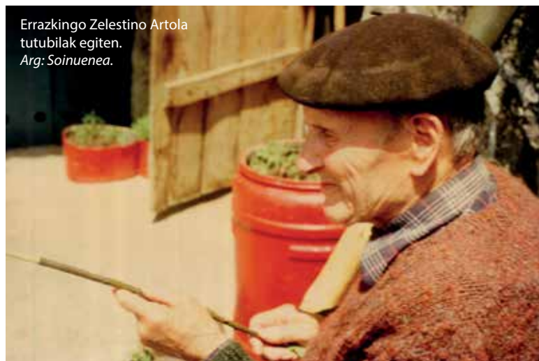
Errazkingo Zelestino Artola tutubilak egiten.

Larraungo herri-dantzen bilduma eskuragai dago Soinuenean eta Mitxausenea Kultur Etxean. Espainolezko bertsioa www.soinuenea.eu atarian eskuragai.