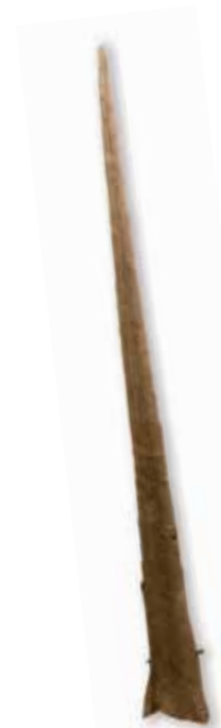
Larraungo sunpriñua.

Bai, momentu askotan jo ohi zuten aspertuta zeudenean edo gogoa zutenean. Artaldeak beti ur putzuetatik edo asketatik gertu ibiltzen ziren eta beraiekin artzaina. Ez zen dantzatzeko doinu bat. Sunpriñuarena artzainen musika da, ez dauka konpasik, librea da. Artzain batek jo ohi zuenean, beste batek entzun eta agian beste puntan jotzen hasten zen. Iribasko Muxkurren adibidez, aska handi bat omen zegoen, eta Iribasko artzainek handik jotzen omen zuten, bertan omen zegoen joaldi ofiziala. Ilunabarrean askotan supriñua hartu eta Iribaskoek jotzen zuten moduan, Baraibarkoek eta ingurukoek ere jotzen zuten eta etxeko ikuluetan lanean ari zirenek ere entzuten omen zuten. Haranean giro bat sortzen zuen horrek.