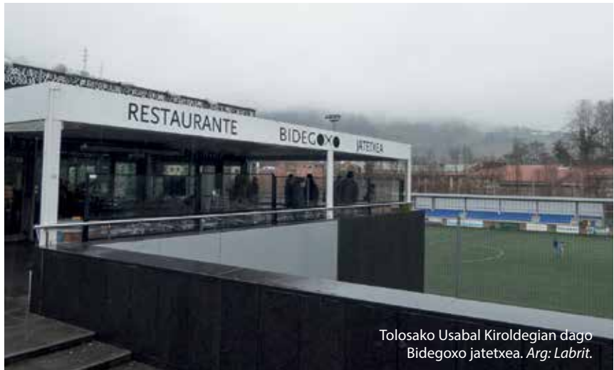
Tolosako Usabal Kiroldegian dago Bidegoko jatetxea. Arg: Labrit.

Idea hoi okurritu zitzaien eta Tolosako udaletxea jun eta aurkeztu nien ze ideia giñauken eta Gizarte Zerbitzuko Departamentukoek onartu zuen. Beak badakite eun hoietan gutxi gorabehera zein dabilzan egoera txarrean. Nik esaten nien laguntzak jasotzen dituztenei ezetz, nik egitazko beharra zuten jendea