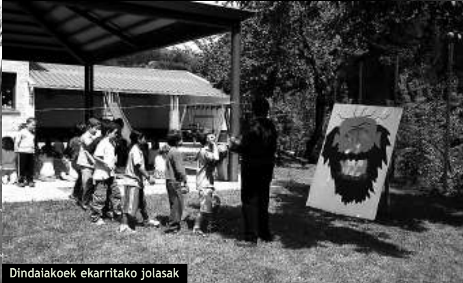
Dindaiakoe ekarritako jolasak

kigun, etorkizuneko pilotari ugari zeudelarik bertan, baita haien guraso ale batzuk ere, espero dezagun zerbait ikasiko zutela.