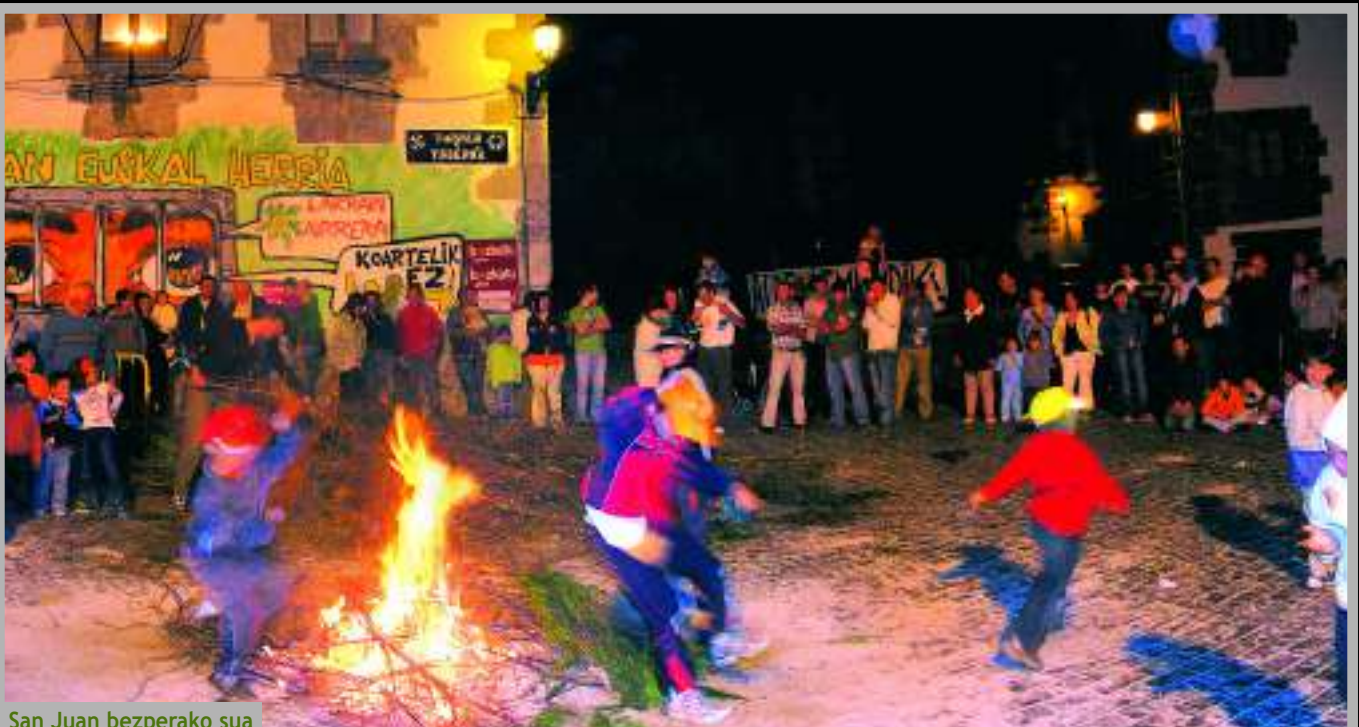
San Juan bezperako sua