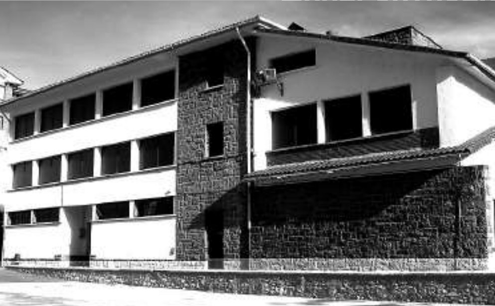
Gaur DBHko Institutua dugu herrian, garai batean Lanbide Eskola genuen.