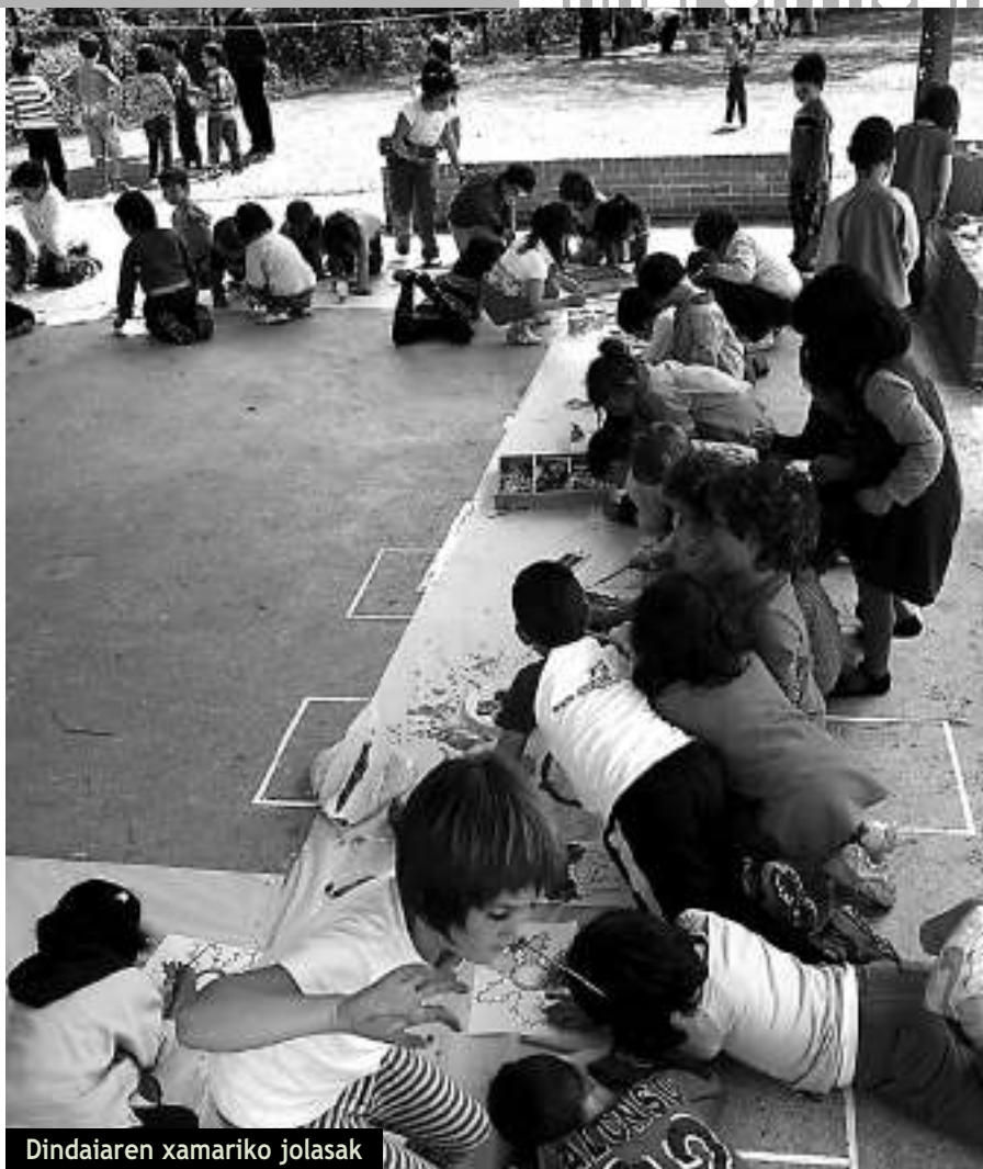
Dindaiaren xamariko jolasak

na hurbildu nahi izandu dugu zerbait interesgarria eskaintzera. Kultur astearen baitan guzien gustuko plateren bat izan zedin nahi baikenuen. Kosta ahala kosta. Eta ekitaldi batzuetan jende kopuru handirik ez bada ere, lehentasuna aniztasuna dugu guk. Kontua ez baita, kultur esparruaren barnean, ekitaldietara doan jende kopurua, baizik eta kultur eskaintzaren aniztasuna, garrantzia eta kalitatea. Eta hori, jakina denez, kantitate hutsak ez du ematen. Ez horixe.