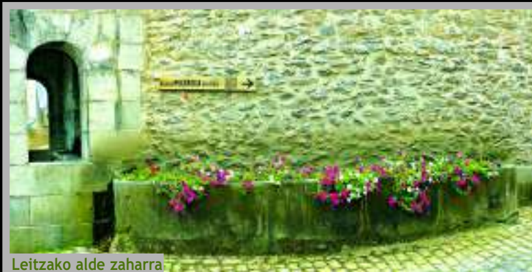
Leitzako alde zaharra