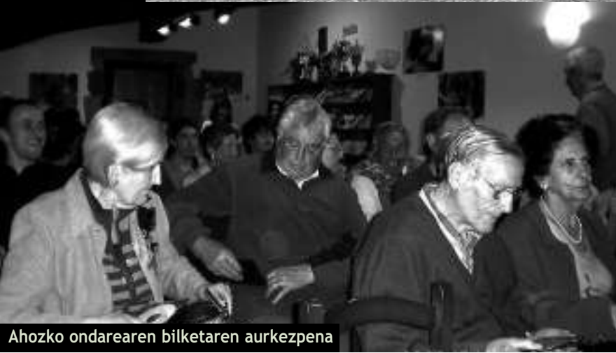
Ahozko ondarearen bilketaren aurkezpena