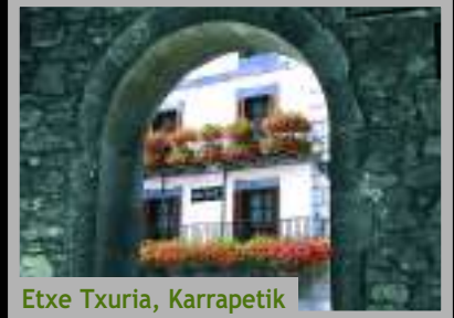
Etxe Txuria, Karrapetik