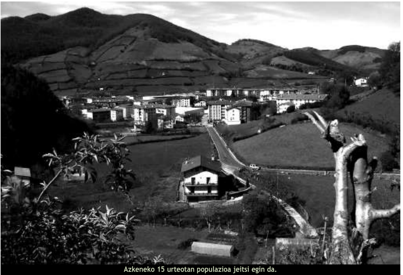
Azkeneko 15 urteotan populazioa jeitsi egin da.