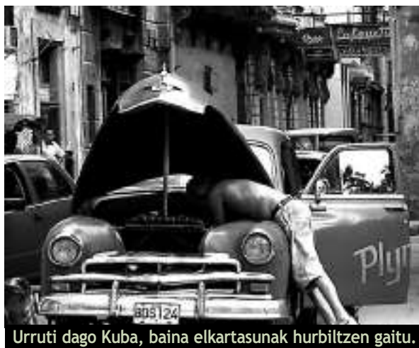
Urruti dago Kuba, baina elkartasunak hurbiltzen gaitu.

Otsailaren 1etik 6ra bitartean Leitzako Kultur Taldeak “Kuba Leitzara” astea an-