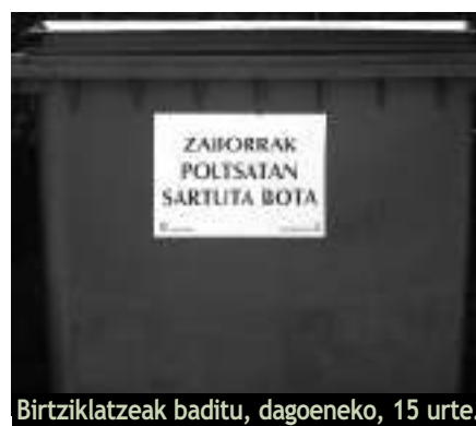
Birtziklatzeak baditu, dagoeneko, 15 urte.

Hemendik aurrera, hiru leku desberdinetara bota behar ditugu zakarrak. Berrreskuratu ezin ditugun hondakinak (janariak, pixoihalak), kontenedore berdeetan botako ditugu. Berreskura daitezkeen produktuak berriz, edukiontzia urdinetara botako ditugu (paper eta kartoi garbia pakete moduan loturik eta latontziak, brik ontziak, plastikozko pote eta botilak, boltsa berean sarturik). Beira edo kristala, orain arte bezala, edukiontzia berezietara botako dugu.”