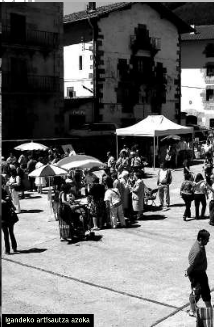
Igendeko artisautza azoka