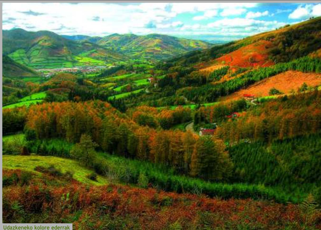
Udazkeneko kolore ederrak