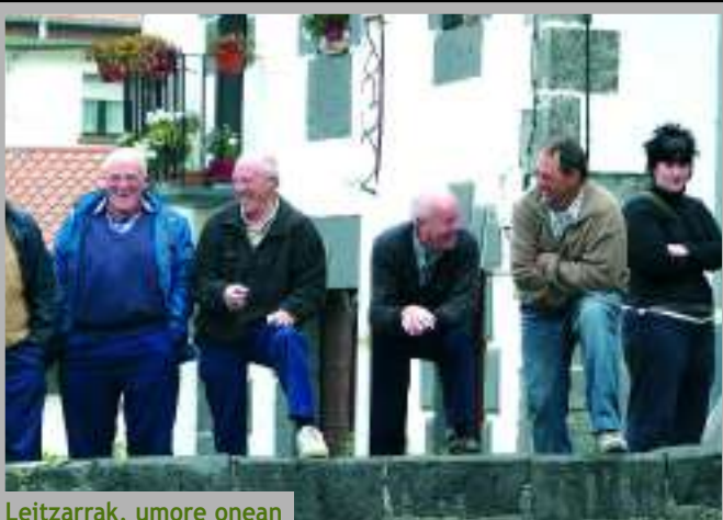
Leitzarrak, umore onean