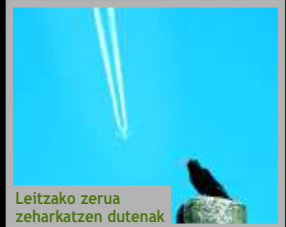
Leitzako zerua zeharkatzen dutenak